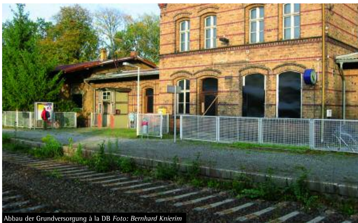
Abbau der Grundversorgung à la DB

Richtig ist: In Italien gibt es eine solche Regulierung. Sie wurde erstmals 1990 mit dem „Gesetz 146“ beschlossen, das im Jahr 2000 nochmals modifiziert wurde („83/2000“). Diese Regulierung wurde unter dem Tarnbegriff „Recht auf Mobilität“ und im Rahmen einer Medien-Kampagne, in der die Eisenbahner und ihre Gewerkschaften