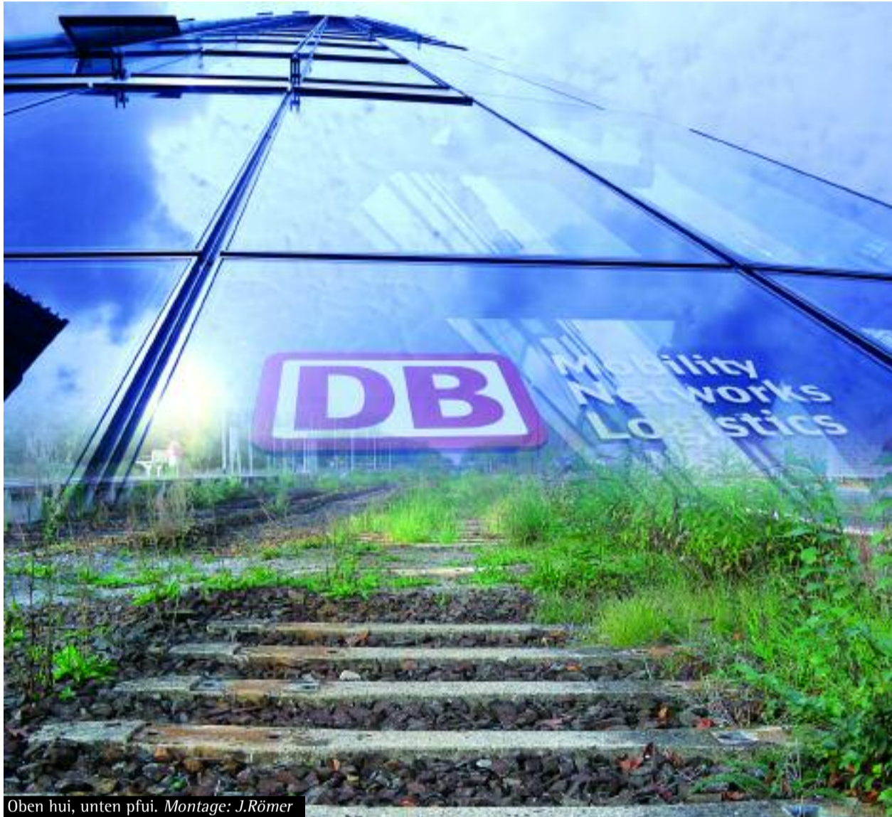
Oben hui, unten pfui.

Investoren-Interessen sind wichtiger als die Interessen von Beschäftigten und Fahrgästen