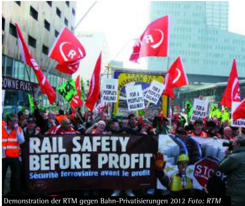
Demonstration der RTM gegen Bahn-Privatisierungen 2012.

Mit welchen Auseinandersetzungen war die RMT in letzter Zeit konfrontiert? Die RMT ist in sehr viele Kämpfe involviert. Ein Bereich, in dem wir in letzter Zeit neue Mitglieder gewinnen konnten, ist der Kampf gegen so genannte Null-Stunden-Verträge und gegen das Out-